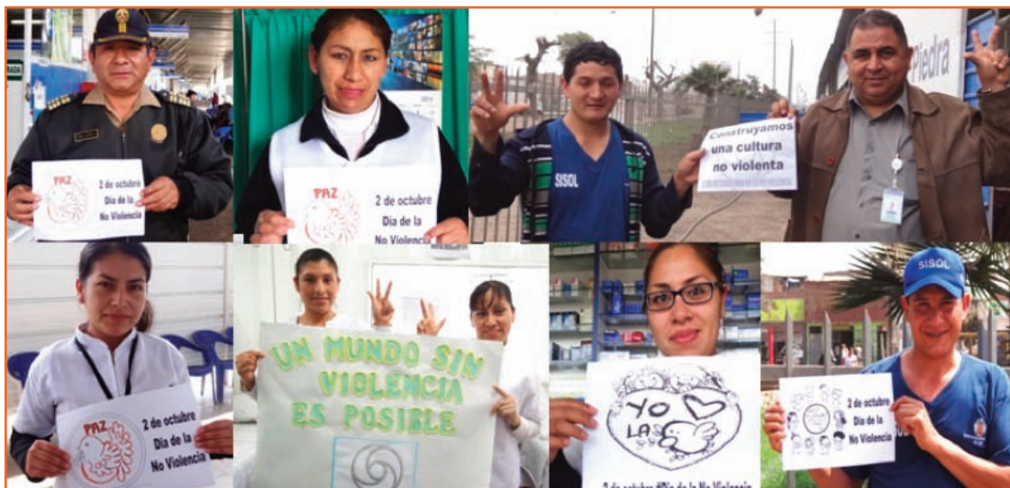
Selfies por la No Violencia con los trabajadores del SISOL Pueblo Piedra

Para llevar a cabo la toma de Selfies por la No Violencia, previamente se realizaron Charlas Informativas en las reuniones cotidianas con los trabajadores del SISOL Pueblo Piedra, y el mismo día 2 de Octubre, se informó a todos los usuarios de los servicios sobre esta actividad y se les invitó a sumarse. Fue unánime las expresiones por la NO Violencia.