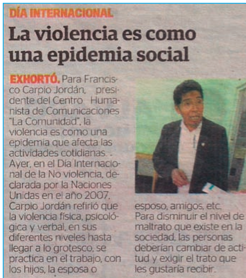
IMAGEN DE PUBLICACIÓN PERIODÍSTICA - DIARIO CORREO-AREQUIPA, 3 DE OCTUBRE 2014

Tuvimos buena acogida por los medios de prensa, 5 emisoras radiales con entrevistas directas desde la actividad, 3 canales TV que al día siguiente difundieron la actividad y dos diarios que al día siguiente, publicaron. En esta vez no tuvimos equipo para nuestro registro.